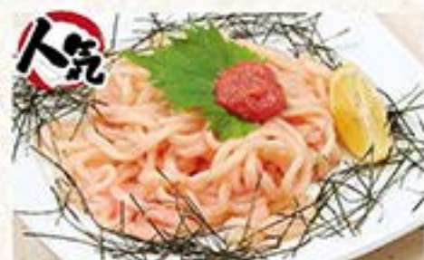
ツルツル麺と明太子のあったかうどん 明太うどん …580円(税込638円)