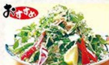
おすすめ 香るハーブとチーズにたっぷり野菜の帝王サラダ シーザーサラダ ... 680円 (税込 748円)