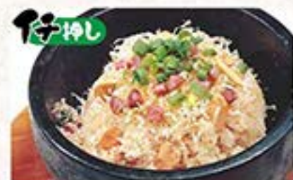
熟々和風のガーリックチャーハン 石焼ガーリックチャーハン …590円(税込649円)