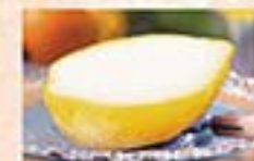
レモンシャーベット …380円(税込418円)