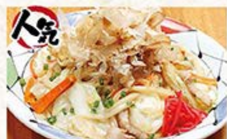
あっさりしていてコクのある醤油ベースの焼きうどん 焼きうどん …690円(税込759円)