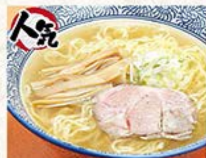
魚介だしに鶏油のあっさりスープ やきとり屋の塩ら~めん …580円(税込638円)

焼きおにぎり(2ヶ) …380円(税込418円) おにぎり(鮭&梅) …380円(税込418円)