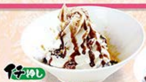
黒蜜きなこバニラ …400円(税込440円)