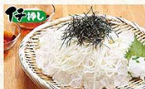
日本3大うどん秋田稲庭。さっぱりで人気のメの逸品 秋田名物 稲庭うどん …680円(税込748円)