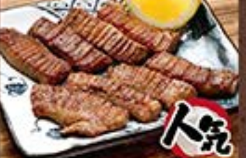
人気 厚切り上タン塩焼き ... 780円 (税込 858円)