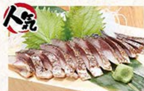
人気 口の中に広がる魚脂と香ばしさを「食べる」でプラスした逸品 炙りしめサバ ... 680円 (税込 748円)