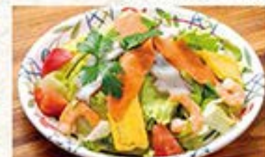
シーフードと新鮮野菜を自家製ベーコン ドレッシングで エビとサーモンの海鮮サラダ ... 790円 (税込 869円)