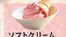
ソフトクリーム …290円(税込319円) ※別メニューをご覧ください。