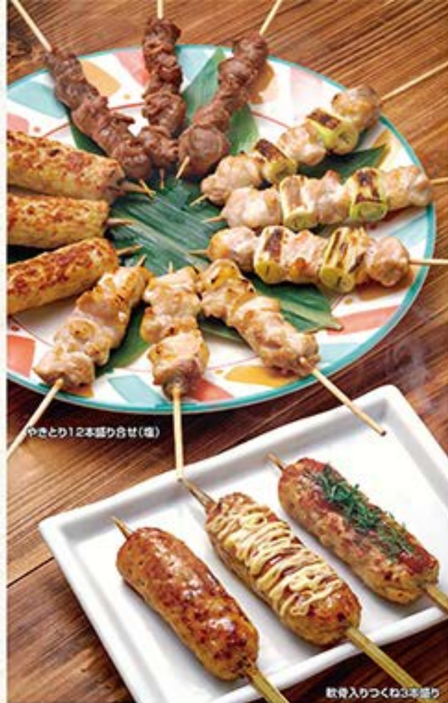
やきとり12本盛り合せ(塩)