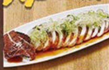
つぼ抜きイカ焼き ... 480円 (税込 528円)