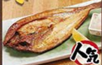
人気 トロほっけの塩焼き ... 780円 (税込 858円)