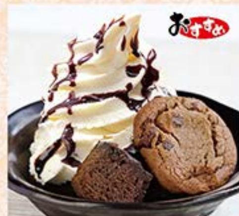
チョコサンデー …480円(税込528円)