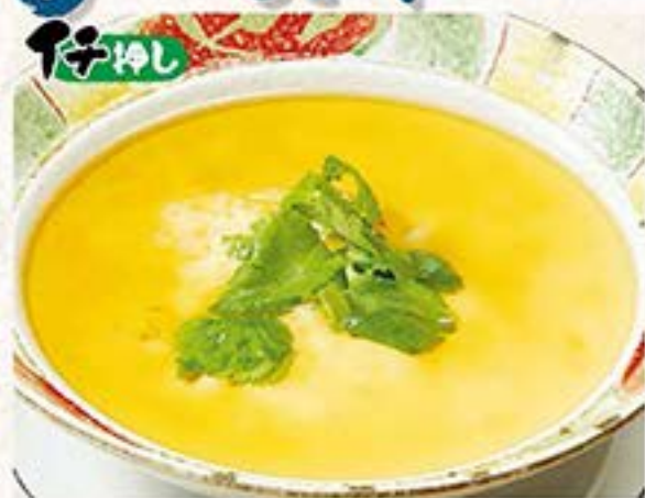
「きらび本店」発祥のオリジナル・ライス茶碗蒸し ライス茶碗蒸し …680円(税込748円)