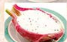
ドラゴンフルーツシャーベット …500円(税込550円)