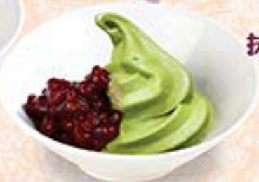
抹茶あずき …400円(税込440円)