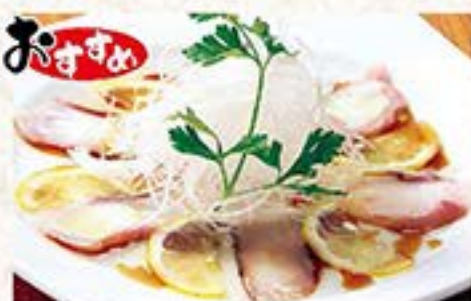
おすすめ 和風仕立てのめっちゃ旨カルパッチョ 生タコのカルパッチョ ... 740円 (税込 814円)