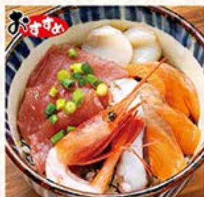
中高ち刺身がたっぷり入ったきらびの海鮮丼 きらび海鮮丼 …780円(税込858円)