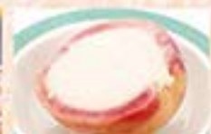
桃のシャーベット …380円(税込418円)