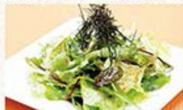
ごま油を使った辛くないお一人様サラダ 和風チョレギサラダ (1人前) ... 380円 (税込 418円)