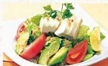
チーズ豆腐とフレッシュ・アボカドの爽やかサラダ チーズ豆腐とアボカドの サラダ ... 740円 (税込 814円)