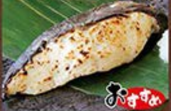
おすすめ 銀だらの粕漬け焼き ... 780円 (税込 858円)