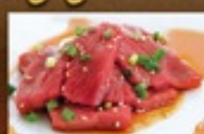
黒毛和牛もも(タレ)