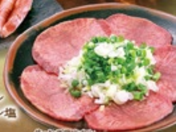
牛・ねぎ塩上タン