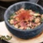
石焼ガーリックチャーハン