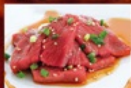
柔らか牛もも(タレ)