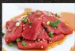
柔らか牛もも(タレ)