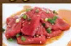
柔らか牛もも(タレ)