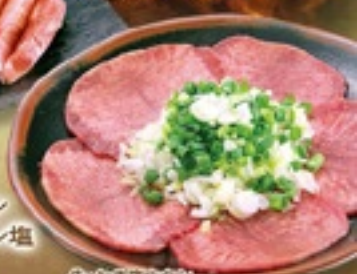
牛・ねぎ塩上タン