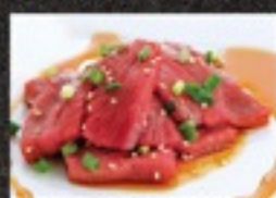
柔らか牛もも(タレ)