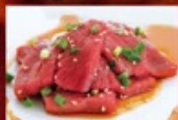
柔らか牛もも(タレ)