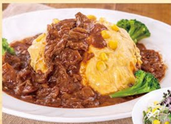
おむらんどハヤシライス