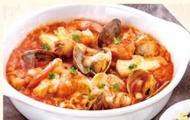
海の幸のトマトリゾット