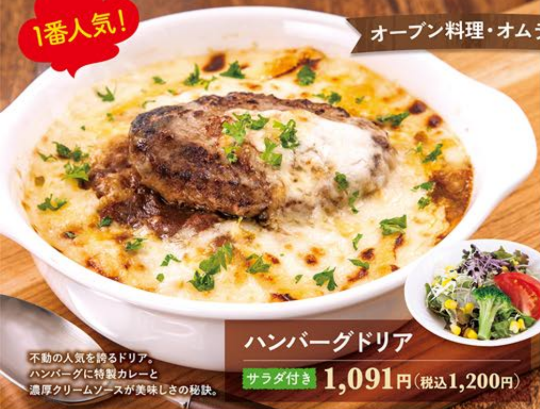
ハンバーグドリア