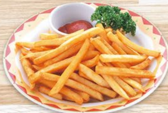
山盛りフライドポテト 610円(税込) フライドポテト 440円(税込)