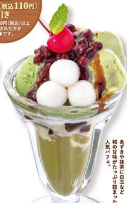
抹茶とあずきのパフェ 646円(税込710円)