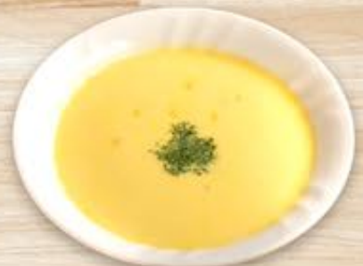
たっぷりコーンの ポタージュスープ 360円(税込)