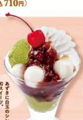
ミニ抹茶パフェ 437円(税込480円)