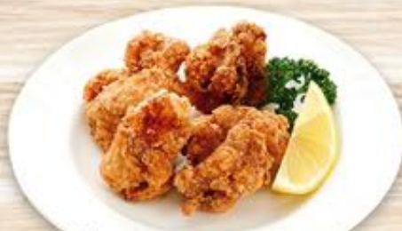
ジューシーチキン 唐揚げ 650円(税込)