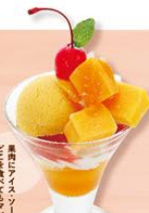
マンゴーパフェ 437円(税込480円)