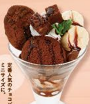
ミニチョコパフェ 437円(税込480円)

抹茶アイスにたっぷりアイスと白玉を ふんだんに使った食後にぴったりサイズの甘味。