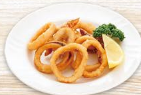
柔らかイカの唐揚げ 440円(税込)