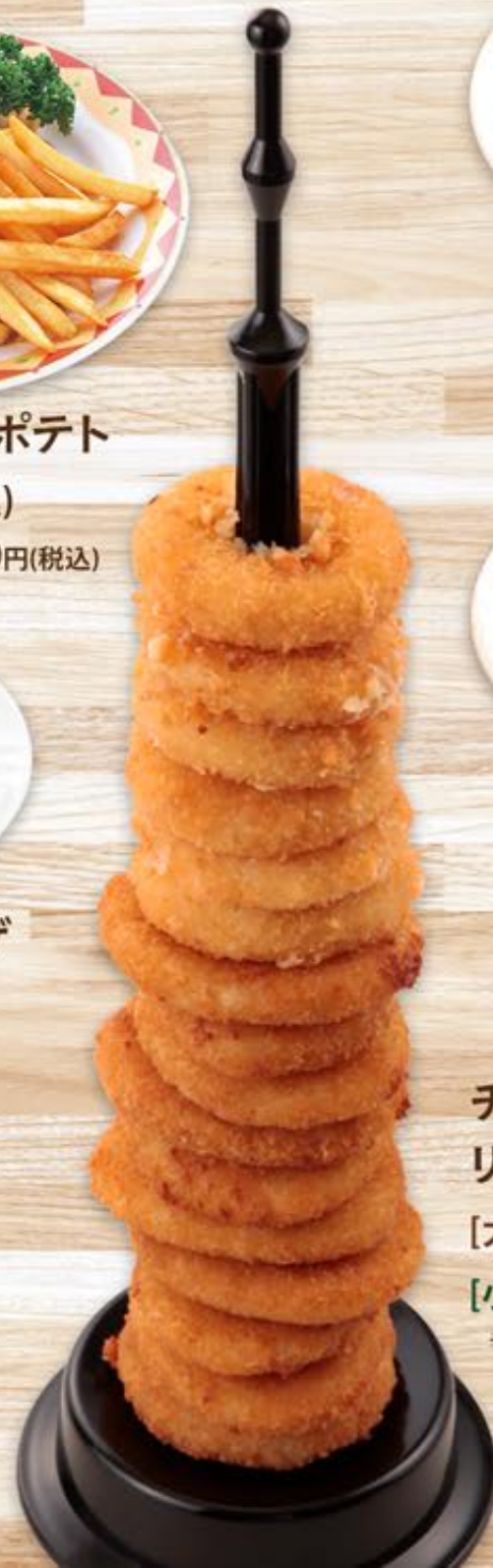
チーズ&オニオンの リングタワー