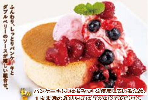
Berry berryのふんわりパンケーキ 619円(税込680円)