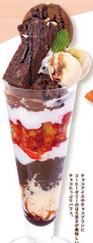
チョコレートパフェ 646円(税込710円)

チョコアイスやチョコプリンに コーヒゼリーのほろ苦さが美味しい チョコたっぷりパフェ。