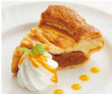
あっぷるパイ 437円 (税込480円)

パンケーキにははちみつを使用しているため、 1歳未満の乳幼児には与えないでください。