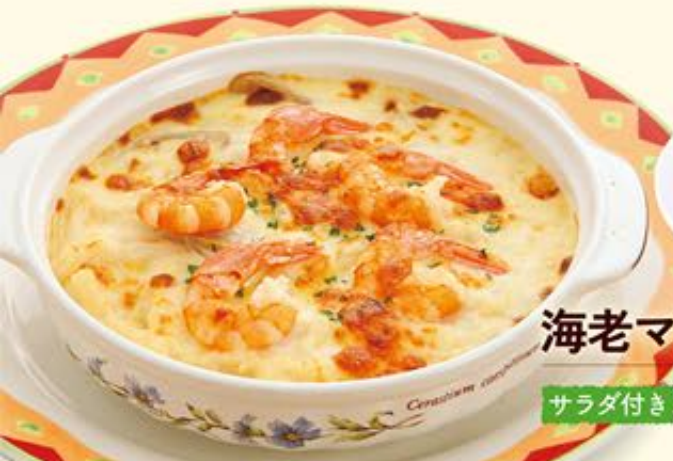
海老マカロニグラタン