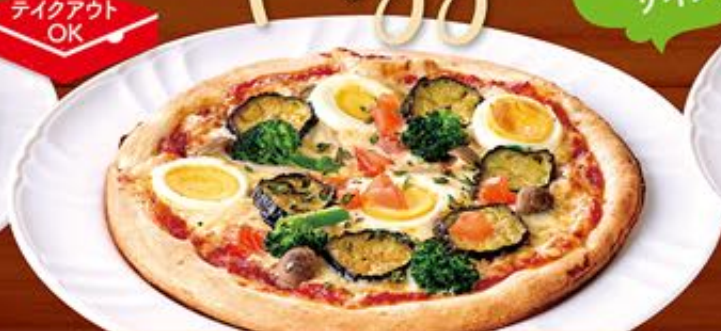
たまごと野菜のピザ