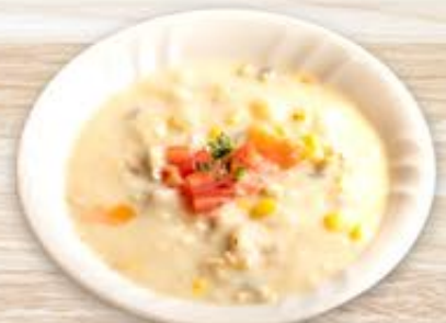
具たくさん クラムチャウダー 360円(税込)