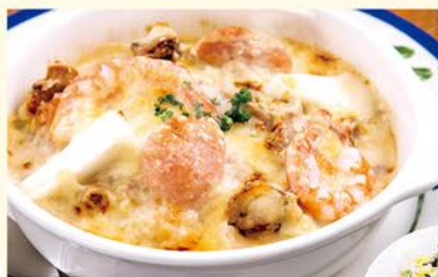
シーフードのドリア

不動の人気を誇るドリア。 ハンバーグに特製カレーと 濃厚クリームソースが美味しさの秘訣。