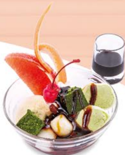
バニラアイスの クリームあんみつ 437円(税込480円)

バニラアイスにさらにアイスの大福を乗せた 贅沢クリームあんみつ。お好みに黒蜜をかけて。