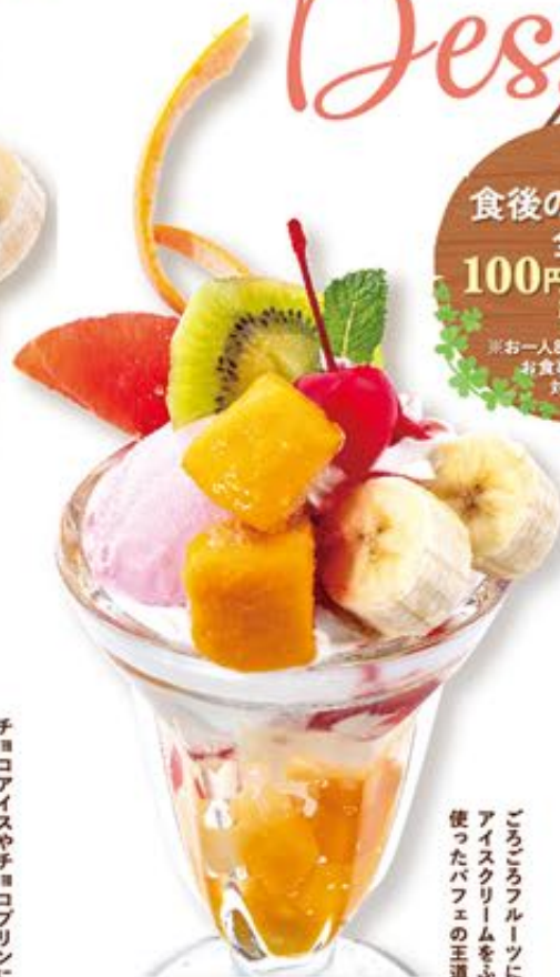
フルーツパフェ 746円(税込820円)

チョコアイスやチョコプリンに コーヒゼリーのほろ苦さが美味しい チョコたっぷりパフェ。