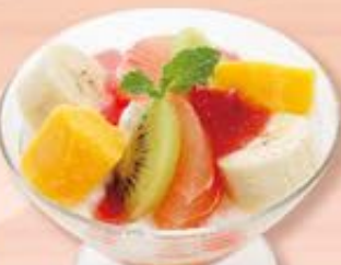
フルーツヨーグルト 437円(税込480円)