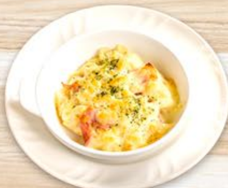
ポテトとベーコンの チーズ焼き 440円(税込)