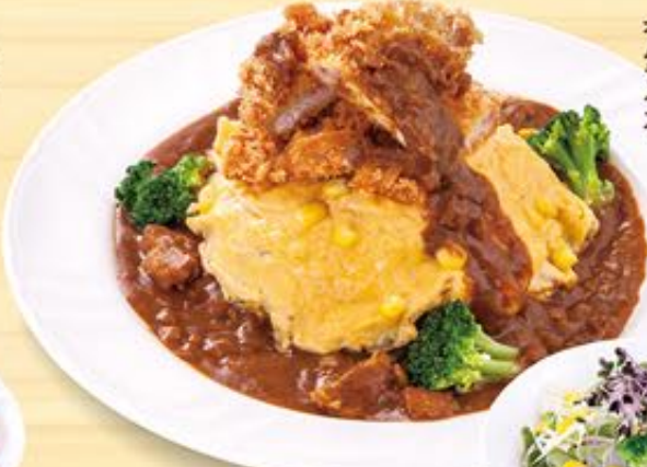
おむらんどカツカレー

自家製バターライスに 濃厚ビーフソースをかけて ふわふわ玉子で仕上げた とろりオムライス。