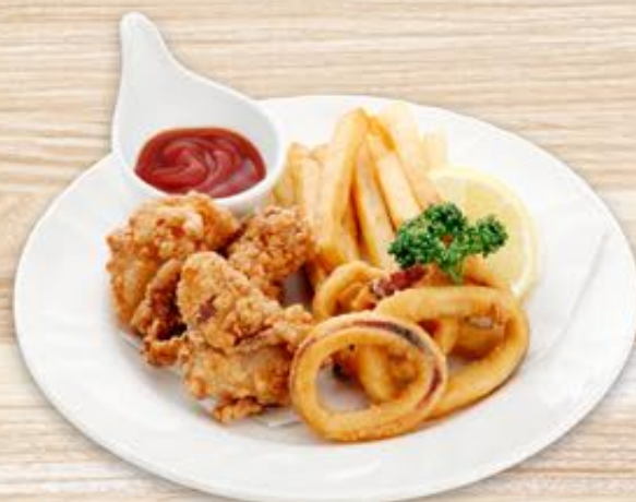
おつまみ3種盛合せ 720円(税込)