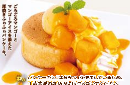
たっぷりマンゴーのふんわりパンケーキ 619円(税込680円)