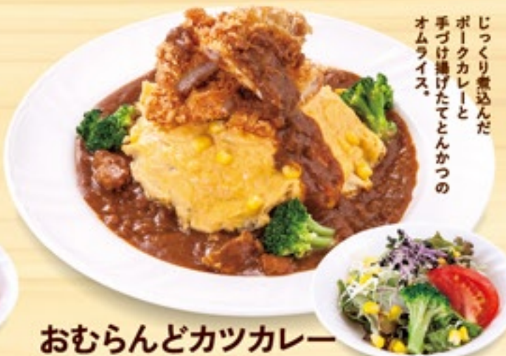
おむらんどカツカレー

自家製バターライスに 濃厚ビーフソースをかけて ふわふわ玉子で仕上げた とろりオムライス。