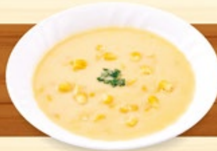
たっぷりコーンの ポタージュスープ 328円(税込360円)