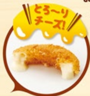
チーズ& オニオンの リングタワー