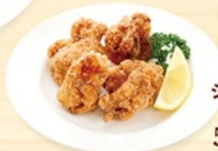
ジューシーチキン 唐揚げ 591円(税込650円)