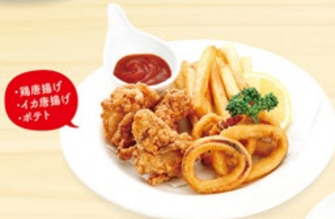
おつまみ3種盛合せ 655円(税込720円)