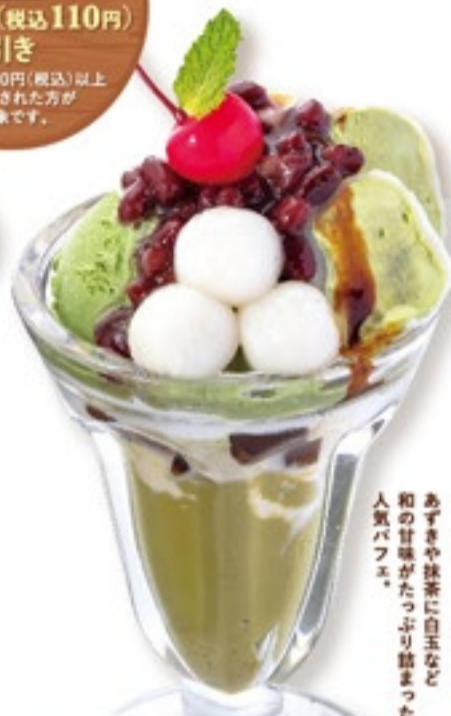
抹茶とあずきのパフェ 646円(税込710円)