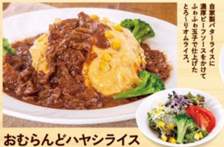
おむらんどハヤシライス