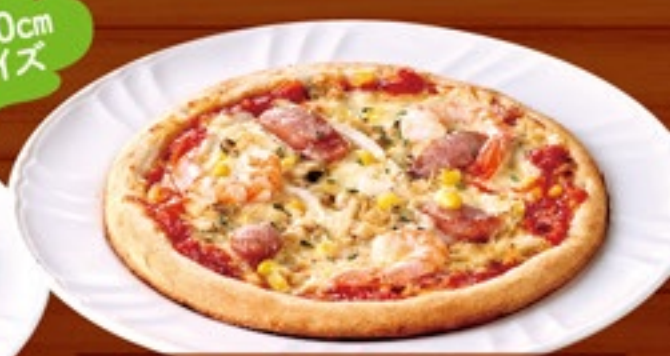
ミックスピザ 637円(税込700円)