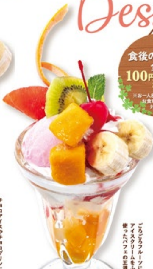
フルーツパフェ 746円(税込820円)

チョコアイスやチョコプリンに コーヒゼリーのほろ苦さが美味しい チョコたっぷりパフェ。