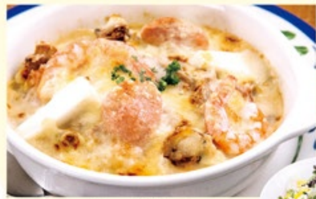
シーフードのドリア

不動の人気を誇るドリア。 ハンバーグに特製カレーと 濃厚クリームソースが美味しさの秘訣。