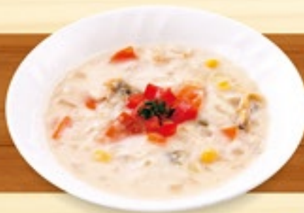
具たくさん クラムチャウダー 328円(税込360円)