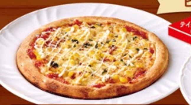
マヨコーンピザ 591円(税込650円)