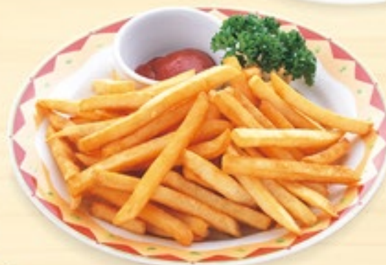
山盛りフライドポテト 555円(税込610円)