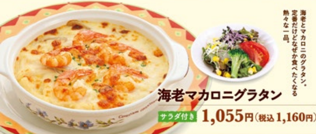
海老マカロニグラタン