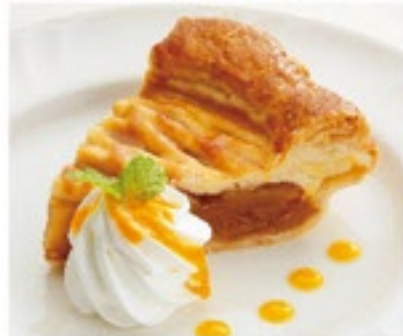
あっぷる パイ 437円 (税込480円)