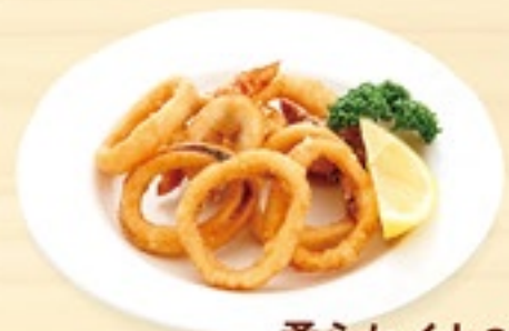
柔らかイカの唐揚げ 400円(税込440円)