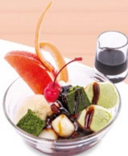
バニラアイスの クリームあんみつ