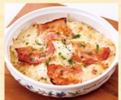
ポテトとベーコンの チーズ焼き 346円(税込380円)