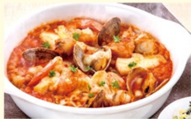
海の幸のトマトリゾット