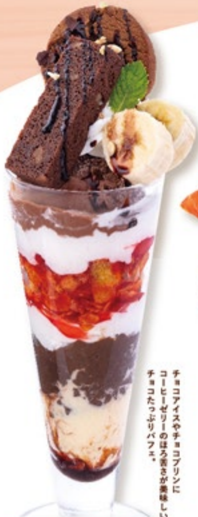
チョコレートパフェ 646円(税込710円)

チョコアイスやチョコプリンに コーヒゼリーのほろ苦さが美味しい チョコたっぷりパフェ。