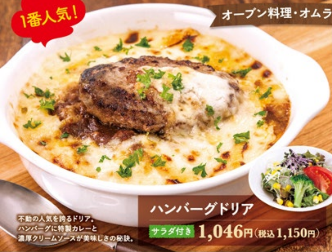
ハンバーグドリア