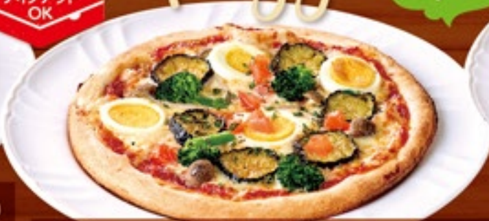
たまごと野菜のピザ 728円(税込800円)